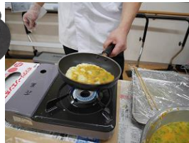
素早くかきませ フライパン技！